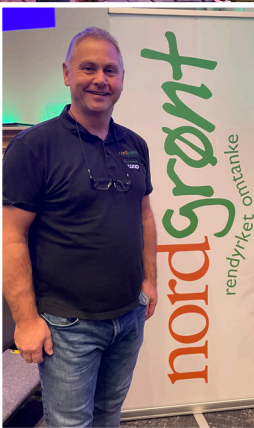
Over: Representanter fra Coop og Nordgrønt på vei til Oljemuséet i Stavanger i forbindelse med den sosiale delen på samlingen til Nordgrønt.